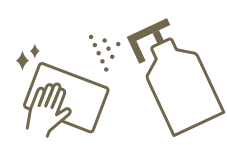
スタッフ共有部、 オフィスにおける消毒の強化 Sanitisation of office and common space for staff

サービスに従事するスタッフはマスク、またはフェイスガードを着用しております。 All staff wear a mask or a face guard.