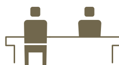
対面を避けた配置 Sit while avoiding face-to-face

お客様が入替わる都度、テーブル/カウンターを消毒しております。 We sanitise tables/counters before and after customers use.