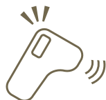
出勤時の体調、 健康管理

Physical condition is checked at time of the attendance.