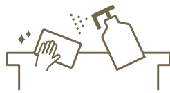
定期消毒の強化 Regular sanitisation

お客様が入替わる都度、テーブル/カウンターを消毒しております。 We sanitise tables/counters before and after customers use.