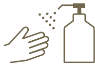
消毒液の設置 Setting sanitisers

各フロアにおけるロビーや、レストラン、ショップ、化粧室に消毒液を設置しております。 We set sanitisers at lobby, restaurants, shops, and bathrooms at each floor.